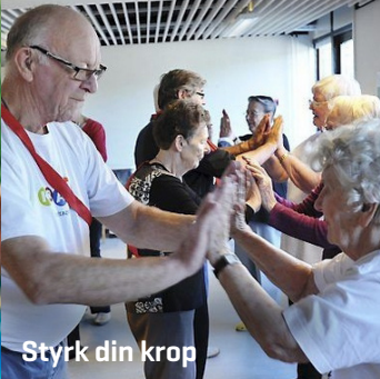
Styrk din krop