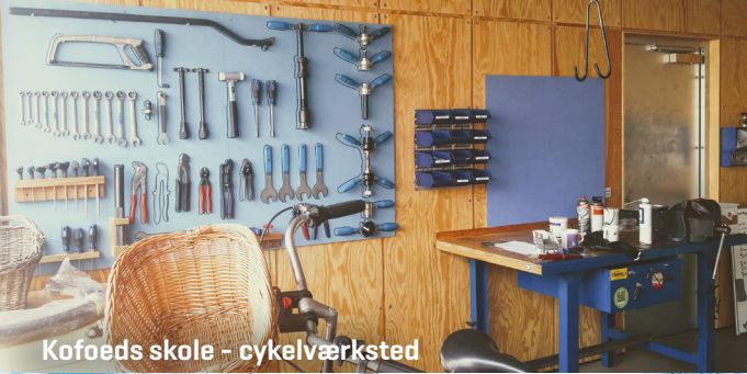
Kofoeds skole - cykelværksted