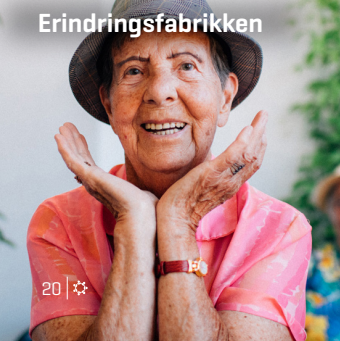
20 | ✨