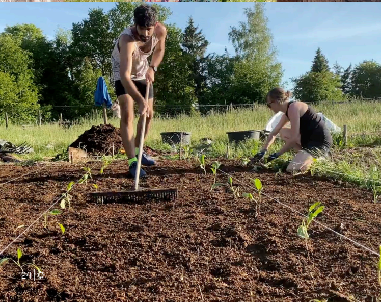
24 | 25