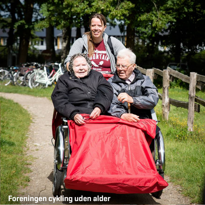
Foreningen cykling uden alder